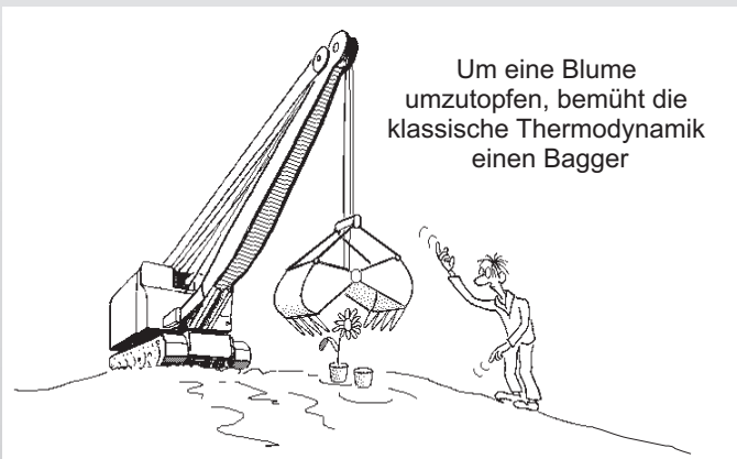
Um eine Blume umzutopfen, bemüht die klassische Thermodynamik einen Bagger